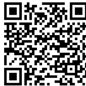
Google Play Store

Um das Gerät mit der Casambi-App verwenden und parametrieren zu können, muss es einem Netzwerk hinzugefügt werden.